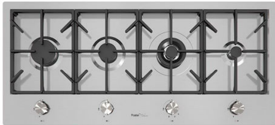
Table de cuisson Foster Milano